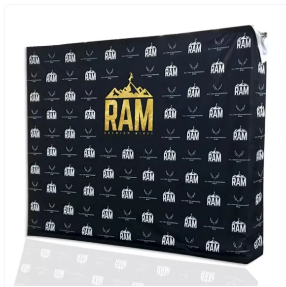
POP UP TEXTIL CON VELCRO