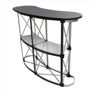
MOSTRADOR MAGNÉTICO ESTRUCTURA