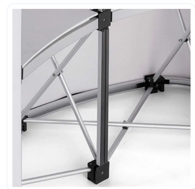
MOSTRADOR MAGNÉTICO PARTES