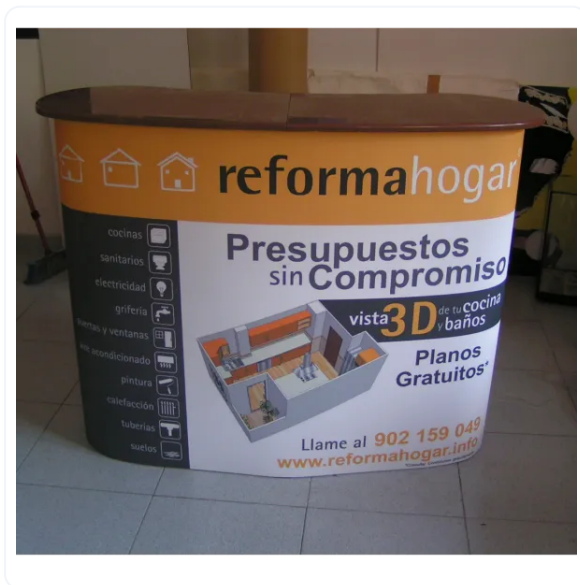
MOSTRADOR PORTÁTIL MAGNÉTICO