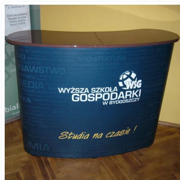
MOSTRADOR PORTÁTIL MAGNÉTICO