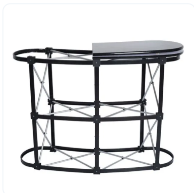
MOSTRADOR MAGNÉTICO TAPA