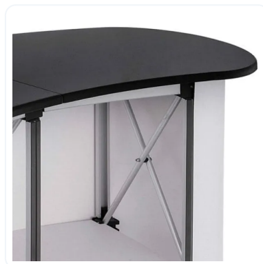
MOSTRADOR MAGNÉTICO DETALLE