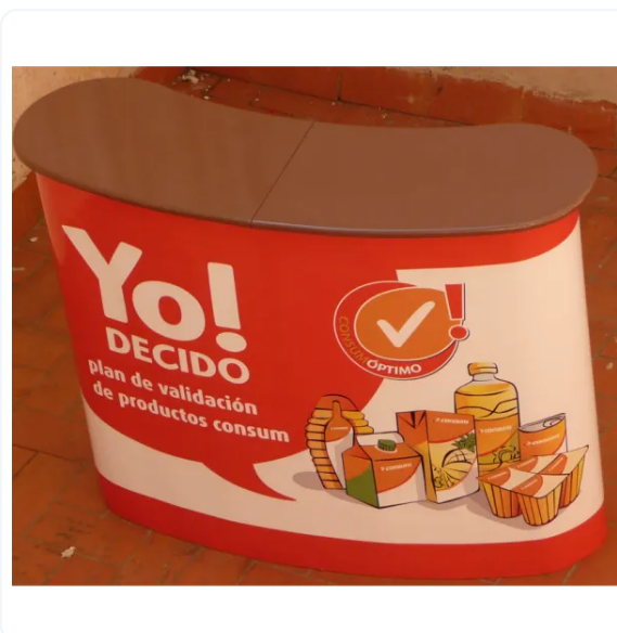
MOSTRADOR PORTÁTIL MAGNÉTICO