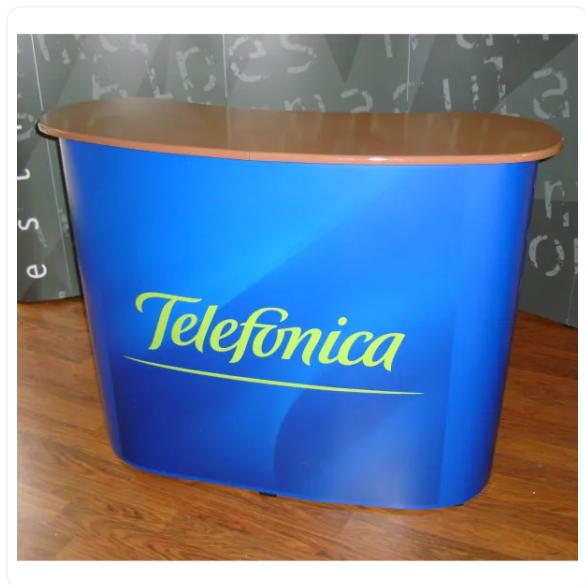
MOSTRADOR PORTÁTIL MAGNÉTICO