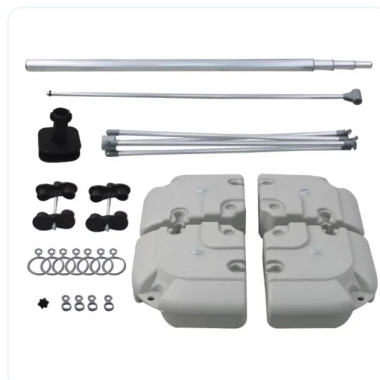
PARTES BANDERA 5 METROS