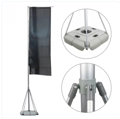
BANDERAS DE 5 METROS