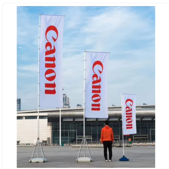
BANDERAS DE 5 METROS